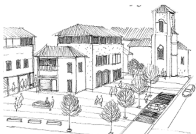
Création d'un cœur de hameau