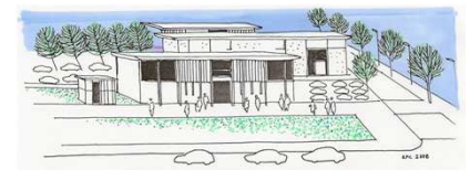
Exemple de bâti commercial